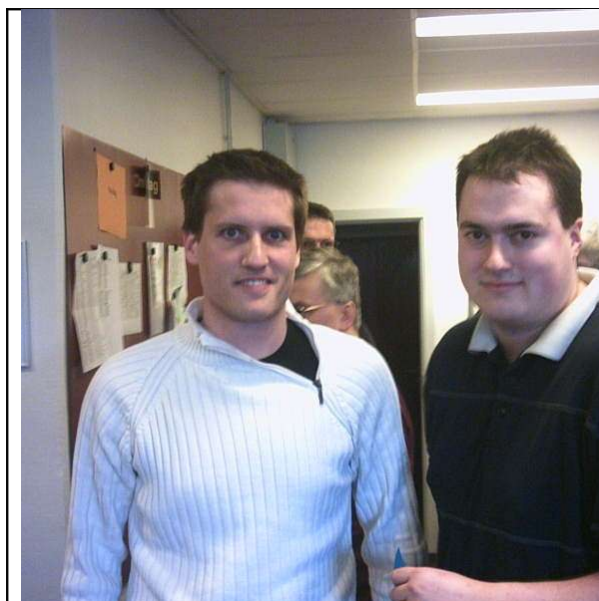
9 Vindere af semifinalens gruppe A