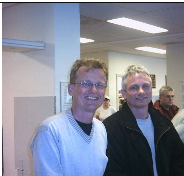
10 Vindere af semifinalens gruppe B